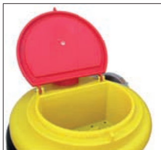
boccaporto con scola filtri