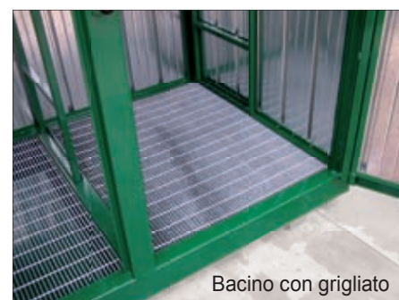
Bacino con grigliato